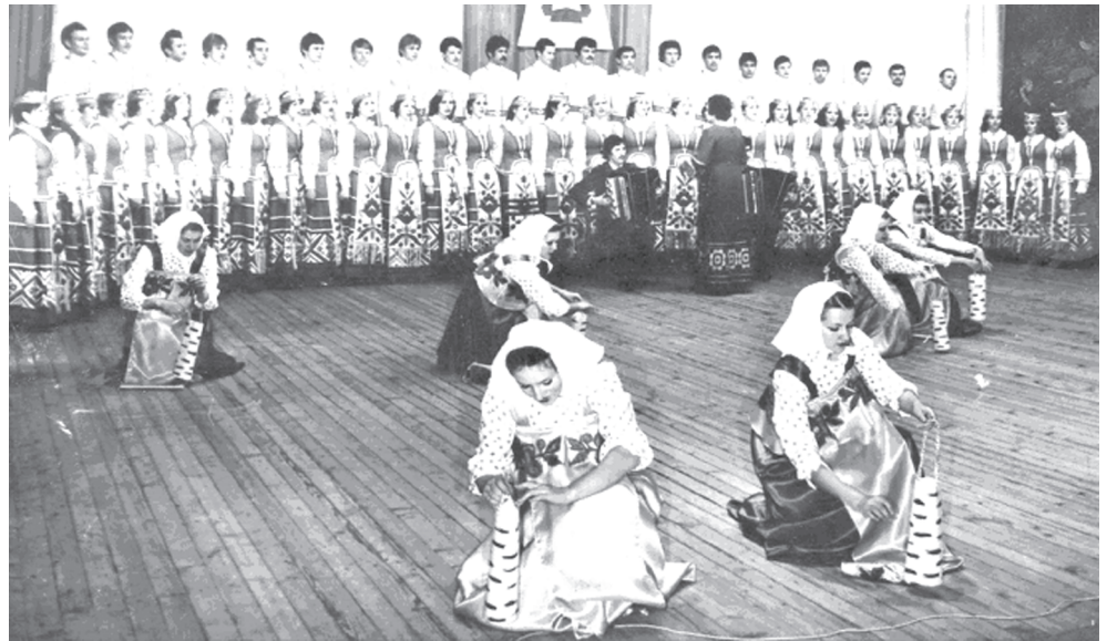
Выступление ансамбля песни и танца «Радость» (1982 г.)

В 1987 г. были разработаны и реализованы предложения по упорядочению структуры академии. Изменен прием на 1-й курс по специальностям с учетом потребности республики в кадрах. Совет академии утвердил новые учебные планы по всем специальностям. В